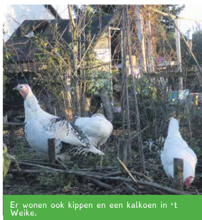
Er wonen ook kippen en een kalkoen in 't Weike.

Fleur: 'De mannetjes- en vrouwtjespauw zitten altijd in hun hok. De mannetjespauw maakt