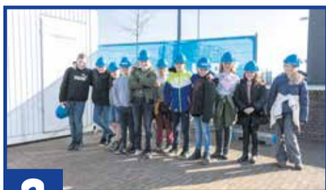
3 Bezoek aan de bouwplaats