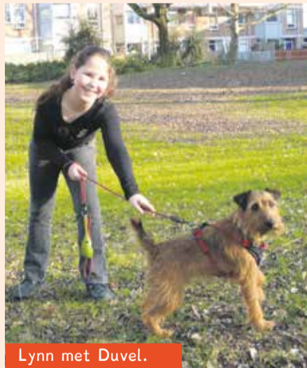
Lynn met Duvel.

Lynn: 'Duvel is een baldadige hond. Hij doet vaak dingen die hij eigenlijk niet mag. Duvel haalt bijvoorbeeld vaak keukenrolpapier uit de vuilnisbak.'