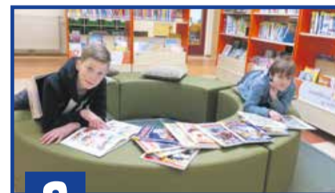
9 Stripboeken lezen