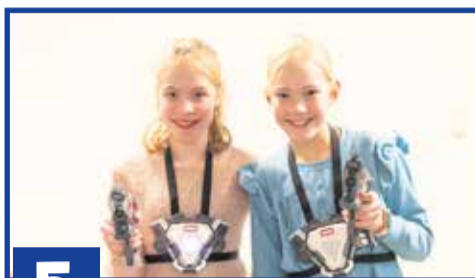
5 Lasergamen bij de Galaxy