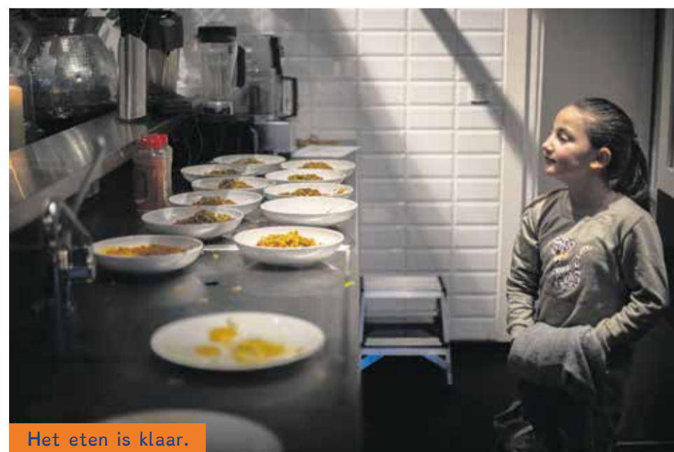
Het eten is klaar.