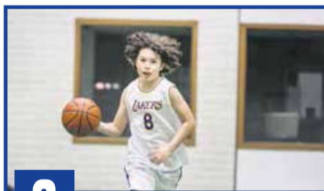
8 Een basketbaltraining